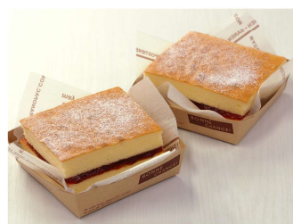
<ロールケーキ (アレンジ)>