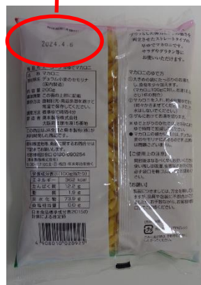
正常商品裏面画像