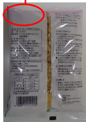
該当商品裏面画像